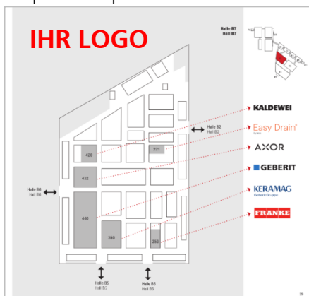
Beispiel Hallenplan Broschüre 2018